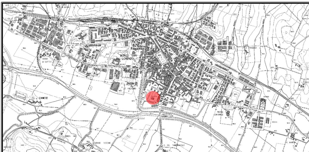
Figura 1 – estratto di CTR 10k